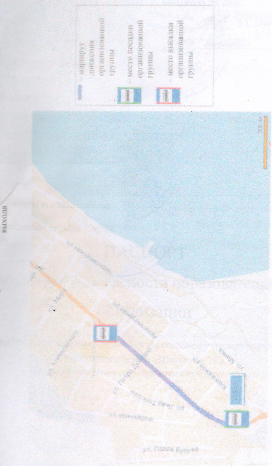
План-схема маршрута движения организационных групп обучающихся от образовательной организации к стадиону и обратно к месту организованного выхода